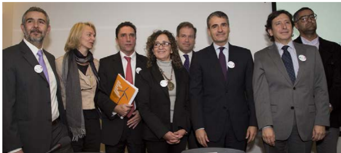
Candidatos y miembros del Comité Ejecutivo de Escenarios Energéticos.

La actividad organizada por Escenarios Energéticos: Chile 2030 se realizó el pasado 12 de abril en el Centro Cultural Gabriela Mistral, GAM, reuniendo a más de 120 personas del sector de energía y medios de comunicación.