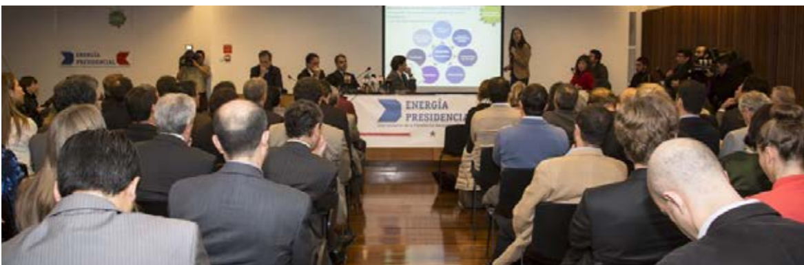
Lanzamiento Energía Presidencial.