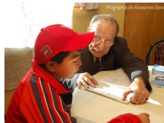
Programa de Asesores Senior