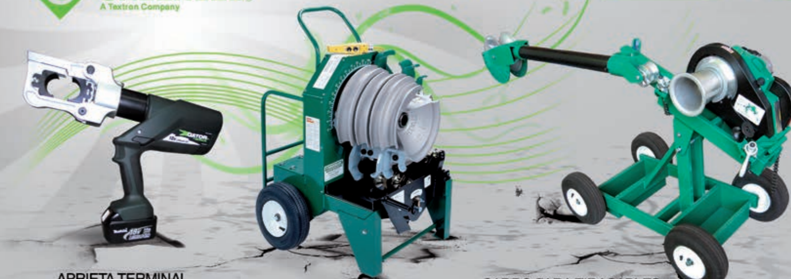
APRIETA TERMINAL BATERIA 18 VOLT No 936.5912