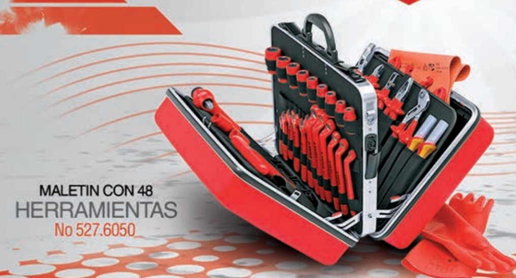
MALETIN CON 48 HERRAMIENTAS No 527.6050