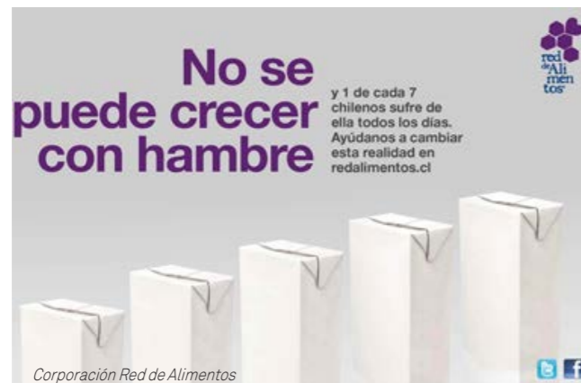
Corporación Red de Alimentos