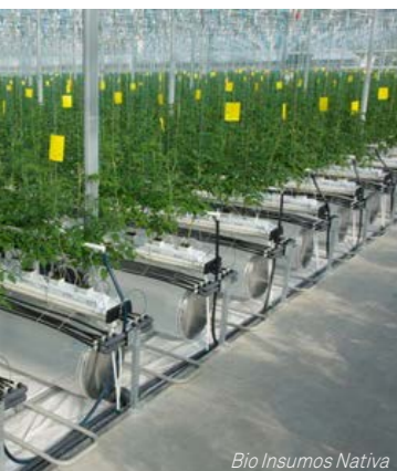
Bio Insumos Nativa